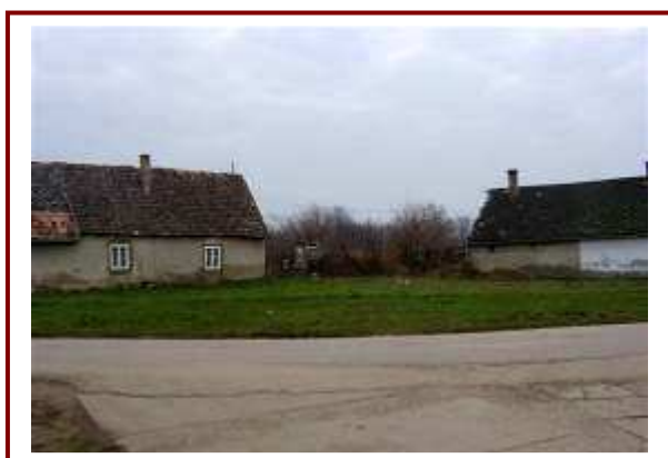
A Damjanich utcai kanyar kiszélesítése, az itt található rossz állapotú házak felújítása, lebontás után újjáépítése jelentősen javítja a faluképet