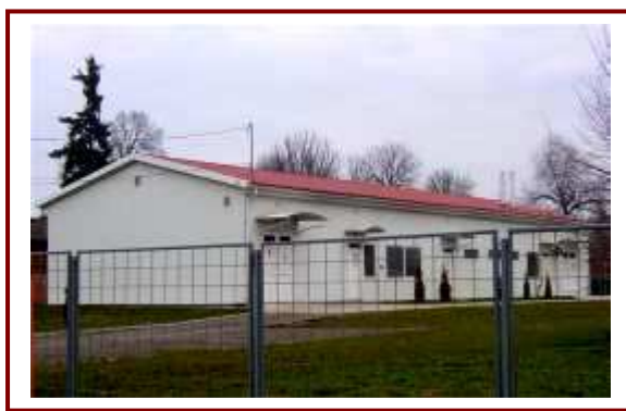
A Pannon Varázs térsztaüzeme