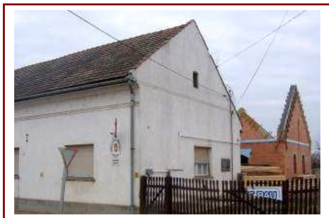
Az eredeti iskola épülete, háttérben a készülő új létesítményekkel

Az iskola jelenleg – ideiglenesen – a valamikori Apponyi-kastélyban működik, ugyanis a fejlesztések egyikeként új konyhával és ebédlővel bővítik az eredeti épületet.