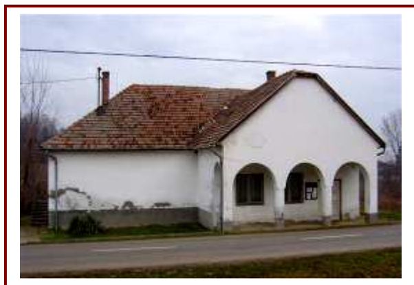
A szőlőhegyi kultúrház