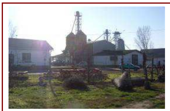
A Medinai Terményszárító Kft. telephelye

Medinán a működő vállalkozások száma összesen 30, egy kivétellel mind jogi személyiség nélküli, többségében egyéni vállalkozás. Közülük a mezőgazdaságban 1, iparban 1, szállításban 1, az építőiparban 3, kereskedelemben, és javításban 6 és egyéb szolgáltatási területen 3 működik. Ha figyelembe vesszük környék földrajzi adottságait, nagyon kevésnek mondható a mezőgazdasági jellegű vállalkozás. Igaz ez még azzal együtt is, hogy többen őstermelőként keresik a megélhetésüket. A foglalkoztatottak száma 29 vállalkozásnál 1-9 fő közötti. Legjelentősebb cégek a Pannon- Varázs térsztaüzeme, illetve a volt tsz területén létrehozott Terményszárító kft., és a Piggy Farm sertéstelep.