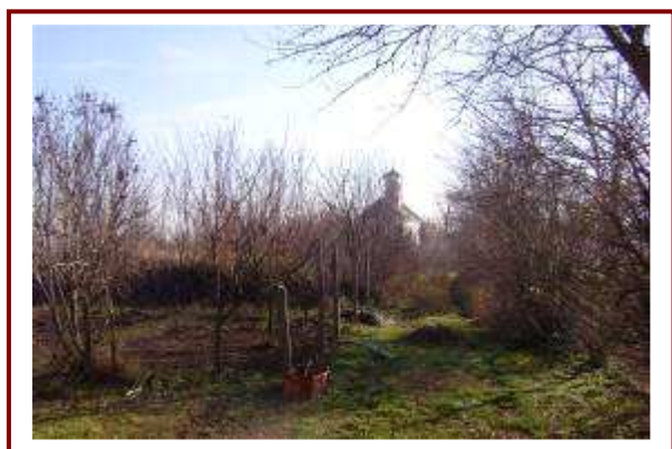
A katolikus kápolna felé vezető út nyomvonala