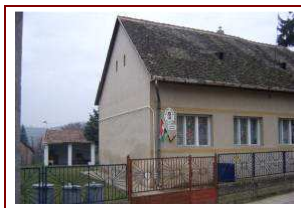
Az óvoda a Petőfi Sándor utcában