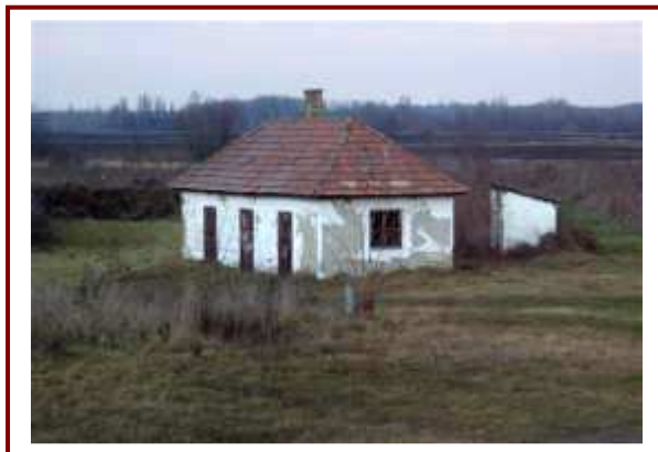
A régi sportöltöző, melynek lebontása után a területen új sportcentrumot kell kialakítani