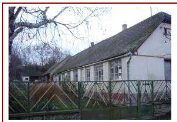
A Siogyongye kézműves alkotóház a Kossuth utcában, mint egyik turista központ