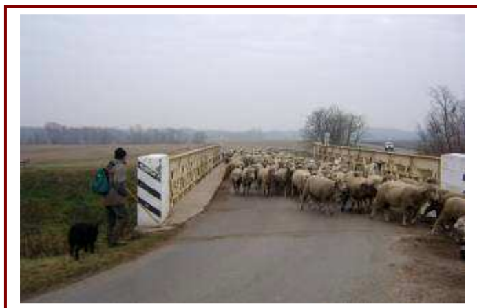
Útban a nyáj hazafelé a Sárvíz hídon

Az elmúlt évben – 2004 – hez képest csökkent, ennek ellenére jelentős, a munkanélküliek száma. Különösen magas az általános iskolát végzett, korábban fizikai foglalkozást betöltött férfiak körében. A szőlészet mellett egyéb mezőgazdasági tevékenységet is folytatnak. A korábban már említett sertéstelep mellett, elsősorban a falu Szedres felőli területein, a Sárvíz és a Sió csatorna közötti réteken többek között ridegtartásos birkatenyésztéssel is foglalkoznak.