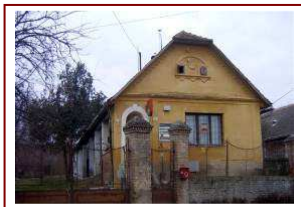
A posta épülete a Kossuth Lajos Bajcsi utcában