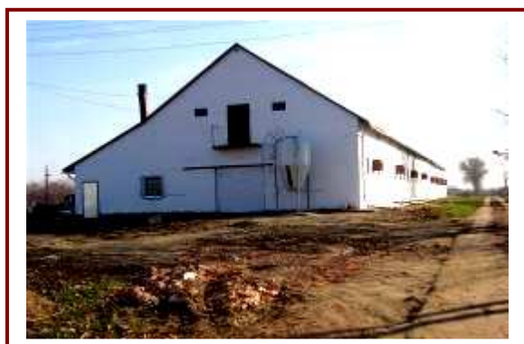
A sertéstelep egyik épülete, a volt tsz területén (Piggy Farm)