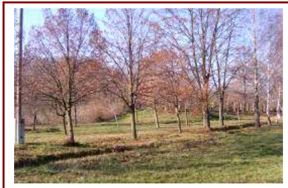
A temető előtti parkoló helye

A Sió parton lévő 02/4-7 hrsz. (er. 02/1) és 458. hrsz. terület rekultivációja mellett a 458. hrsz-on közpark kialakítására van lehetőség. A bejárásakor felmerült, hogy a terület közelében (456.hrsz.) vélhetően melegvíz forrás is található. Ennek feltárása, majd kiépítése, akár pályázati úton is, jelentősen növeli a település turisztikai törekvéseit. A vele szomszédos 453-455 hrsz. ingatlanokkal együtt üdülő, és más turisztikai épületek létesítésére alkalmas területet kell kijelölni. A Halom-hegyről lefolyó esővíz, és annak hordalékának megfelelő elvezetése a 100. hrsz-on lévő árokba elengedhetetlen. Ezek az építészeti és esztétikai változások javítják a falu arculatát, azt vonzóbbá teszik, így ezek, ha hosszabb távon is, de megtérülő beruházások.