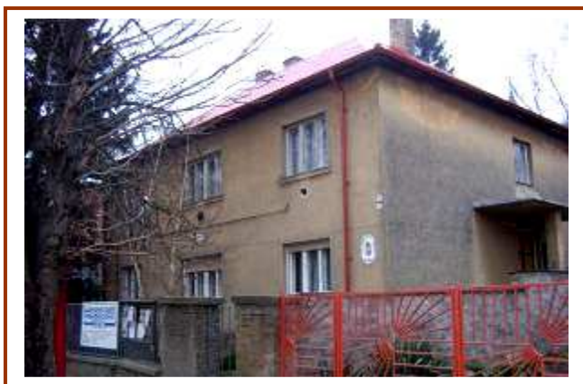
Medina község polgármesteri hivatala

A településfejlesztési koncepció tartalmi követelményeit a BM. Településfejlesztési Iroda által kiadott „Útmutató a településfejlesztési koncepció készítéséhez - településfejlesztési füzetek 24. számának figyelembe vételével állítottuk össze.)