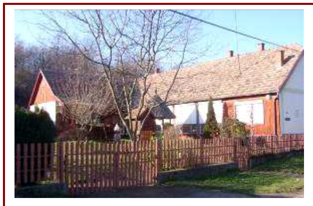
A „Papagájház” Medina - Szőlőhegyen

A 14 településből álló szekszárdi történelmi borvidék Zombai Hegyközségéhez tartozó területen a mai napig jelentős tevékenységnek számít a szőlőtermesztés, a borászat. A szőlő, és a szép környezet az utóbbi években németeket is ide vonzott, akik több családi házat megvásároltak, majd azokat felújították. A legismertebb közülük az un. „papagájház” ahol a tulajdonos madarakat, elsősorban papagájokat tenyészt.