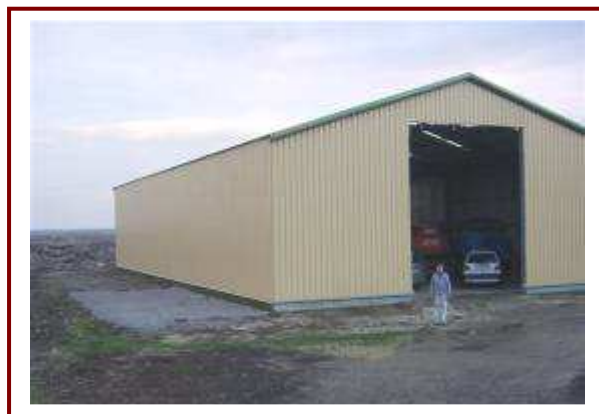
Egy mezőgazdasági vállalkozás telephelye Medina-Szőlőhegyen