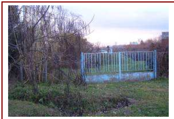
A melegvízkút feltételezett helye a vízműnél