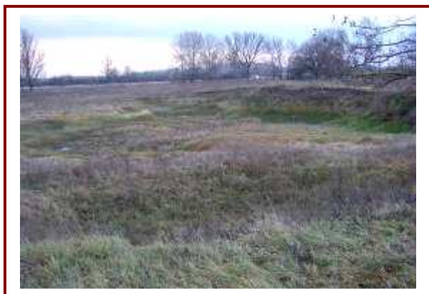
A 02/1 hrsz. és a 458. hrsz. területek, melyek rekultivációja szükséges