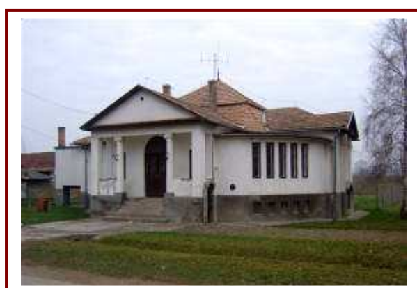
A Hőskert melletti kultúrház felújításra szorul