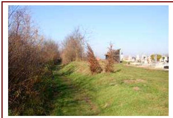
A temetők között burkolt út kiépítése szükséges