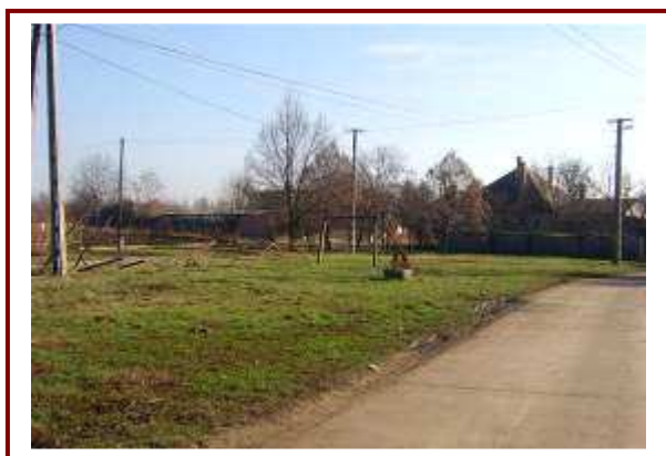
Kialakítandó park, játszótér a Kölesdi utca, Zs. Utca, Petőfi utcai háromszögben