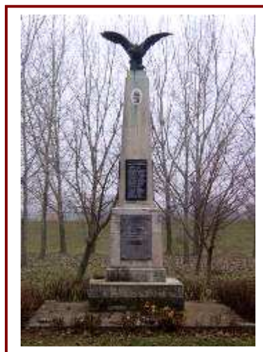
Emlékmű a Hóskertben, amely köré közparkot kell létesíteni