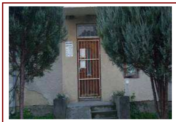
Az orvosi rendelő a Kossuth utcában