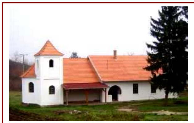
A szépen felújított és panzióként is működtethető volt szőlőhegyi iskola és kápolna

Medina és Medina- Szőlőhegy fejlesztésének összehangolásával a turisztikai vonzerő növelhető, így a korábbi beruházások, például a szőlőhegyi volt iskola és kápolna panzióvá alakításával járó kiadások is megtérülnek.