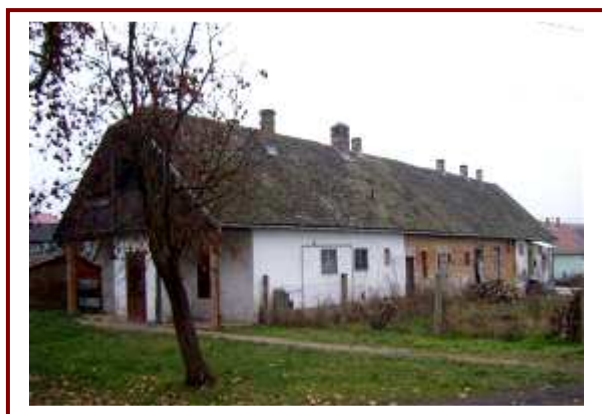
A lebontandó „cselédház”