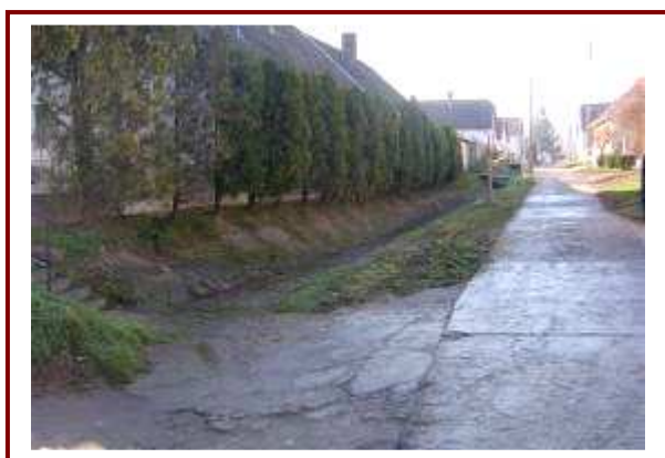
Az Arany János utcai a vízevezetés megoldása nélkülözhetetlen