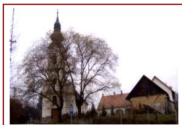
A református templom, mely köré konferencia-központ is épül