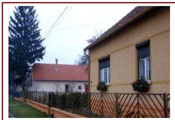
„Németek” által felújított szőlőhegyi családi házak