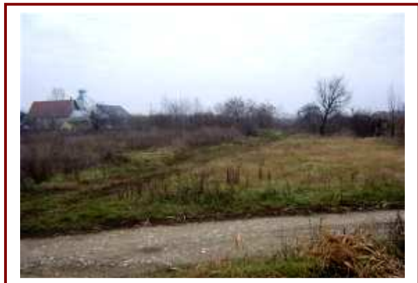
Itt tervezik bevezető utat a gabonaaszárítóhoz