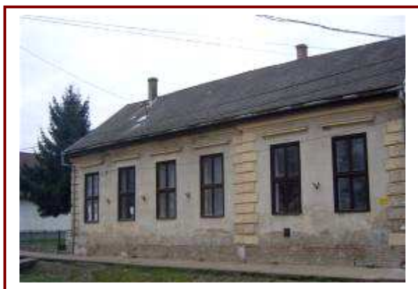
A Kossuth utcai épület könyvtárként és házasságkötő teremként is funkcionál