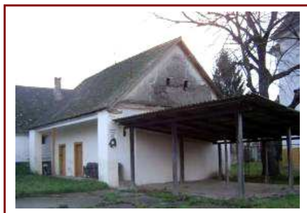
Az ortodox templom mögötti Szerb-klub korszerűsítése szükséges