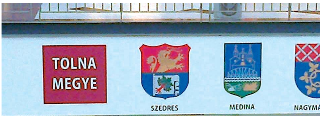
Medina címere a többi Tolna megyei címér között látható a budapesti WestEnd City Centerben