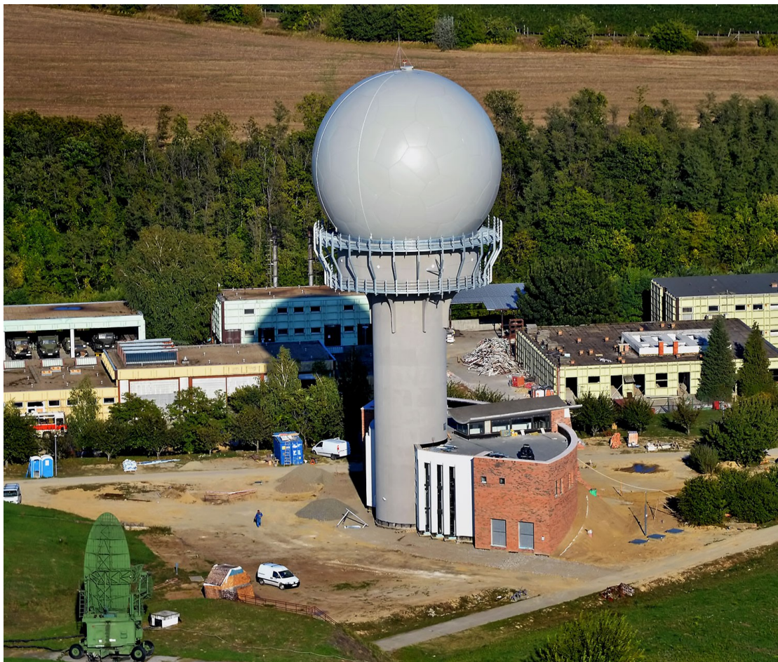
Radarvégállomás: hamarosan üzemel a medinai objektum

Jól halad a medinai radar tesztelése a Honvédelmi Minisztérium tájékoztatása szerint. A tárcától megtudtuk, hogy az új berendezés érzékelhetően javította a légtérelőrzés információellátottságát. A rendszer tesztelése májusban fejeződik be, s az eredmények értékelése után várhatóan júliusban áll hadrendbe a medinai lokátor.