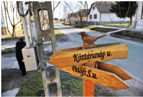
Útelágazás Medinán Móricz Simon

A tervezett katonai radarnak helyet adó Medina polgármestere korábban azt nyilatkozta lapunknak, hogy a falu nem vár kárpótlást a HM-től. Vagy mégis?